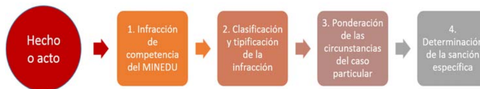
Figura 1. Esquema del proceso de determinación de sanciones

Con el objetivo de dotar de mayor predictibilidad al procedimiento administrativo sancionador y mejorar el carácter compensatorio de las sanciones, la imposición de estas en el ámbito del presente Reglamento debe seguir el esquema propuesto en la Figura N° 1 .